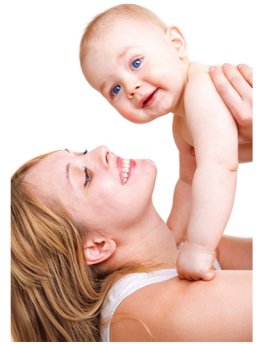
Satu contoh Carta Kehamilan CHOICE

Maklumat yang anda berikan akan dihantar ke Makmal di Perancis dan Carta Kehamilan CHOICE anda akan siap dalam 12 hari bekerja dari penerimaan borang permohonan.